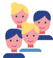
Средняя численность работников по основным видам экономической деятельности в % к итогу